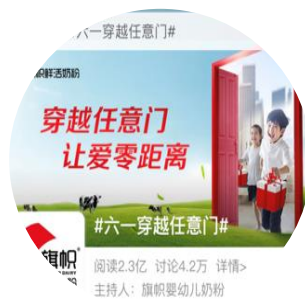
微博话题 曝光量2.64亿+ 完成率 147%