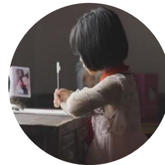
暖心的 具有纪录片属性的视频