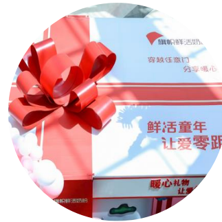
创意的 商圈概念礼盒及任意门