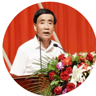
真实的 福建西津畲族小学